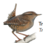
Troglodyte mignon Troglodytes troglodytes