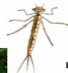
La larve de demoiselle (19 à 29 mm)