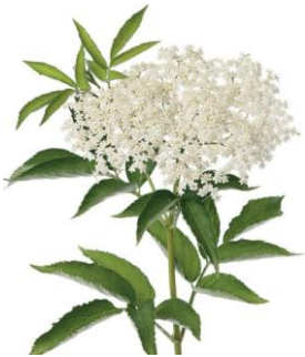
fleur de sureau